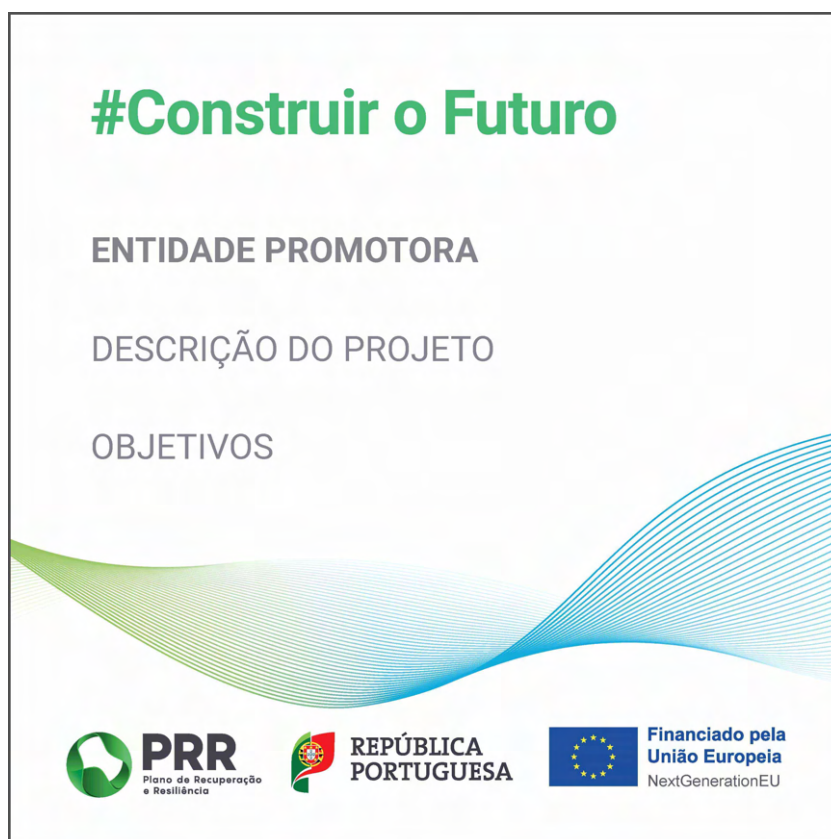
Modelo 3 – Formato 40cm (L) x 40cm (A)

Os painéis ou placas permanentes devem manter-se durante a existência do projeto. No caso de não ser possível, devem manter-se pelo período mínimo de 10 anos.