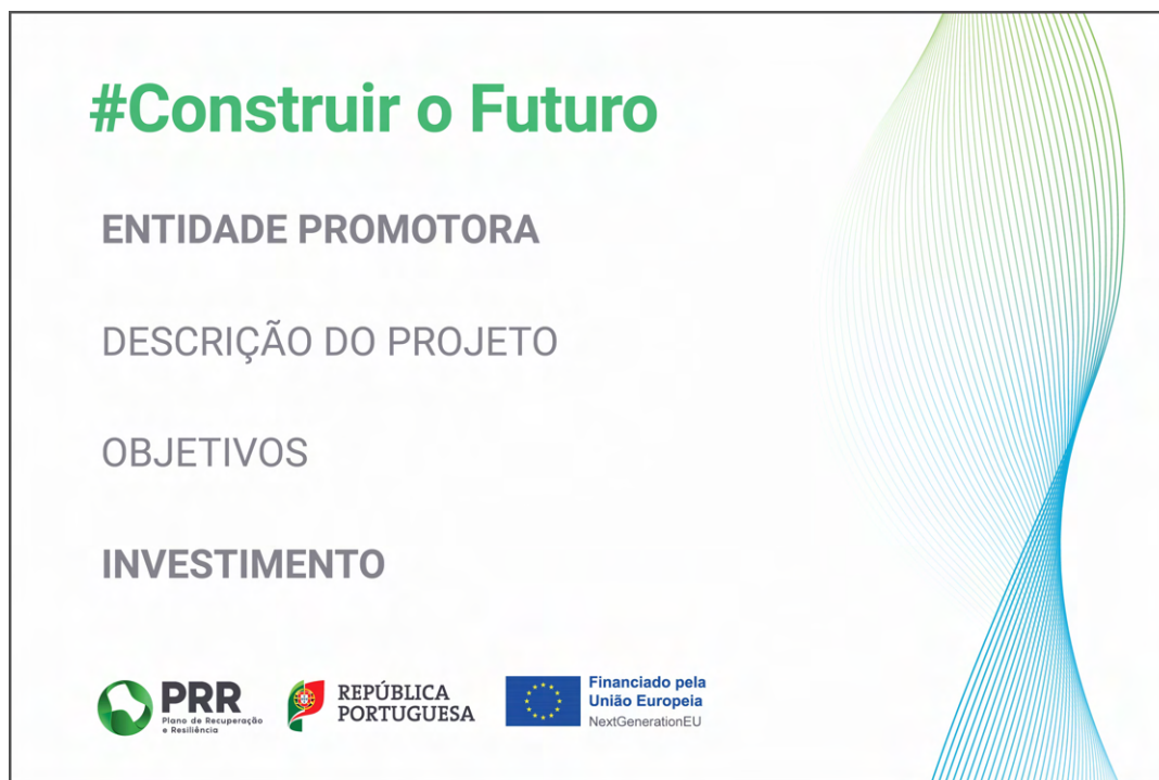
Modelo 2 – Formato 150 cm (L) x 100 cm (A)