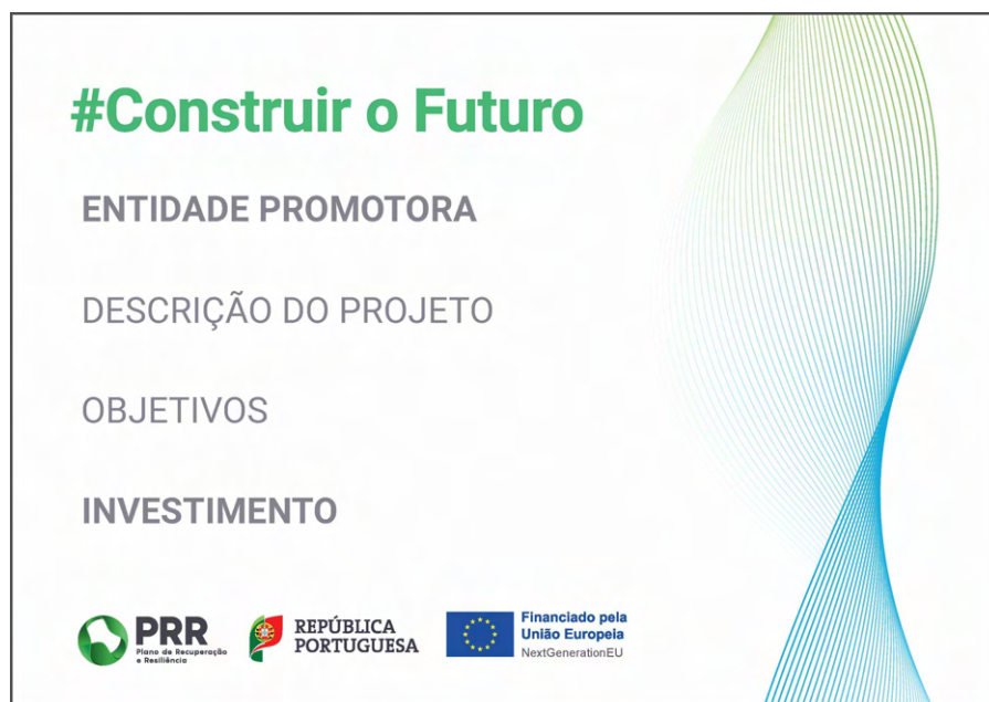
Modelo 1 - A3 ao baixo: 42 cm (L) x 29,7 cm (A)